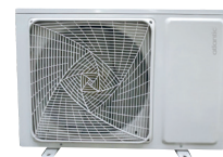
1U 018 NBR