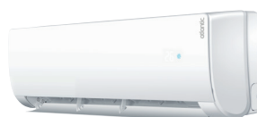
AS 009 et 012 NB