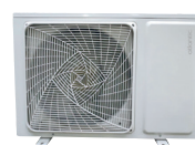
1U 009 et 012 NBR