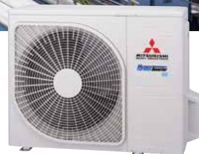
SRC20ZSX-W · SRC25ZSX-W · SRC35ZSX-W SRC50ZSX-W1 · SRC60ZSX-W1