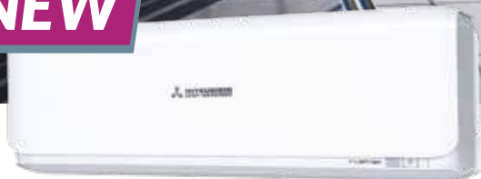
SRK20ZSX-W · SRK25ZSX-W · SRK35ZSX-W · SRK50ZSX-W · SRK60ZSX-W