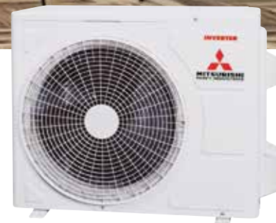
SRC25ZSP-W · SRC35ZSP-W · SRC45ZSP-W