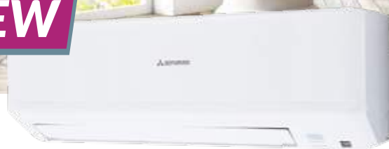
SRK25ZSP-W · SRK35ZSP-W · SRK45ZSP-W